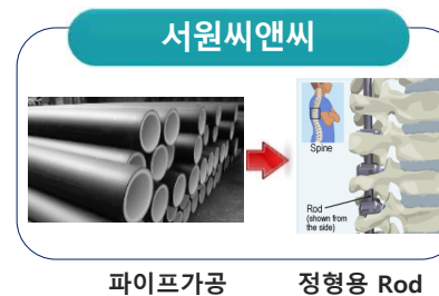
파이프가공 정형용 Rod